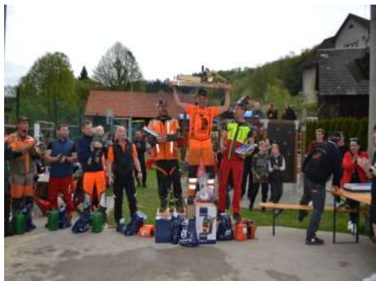
Prlovský drvař (13. května 2023)