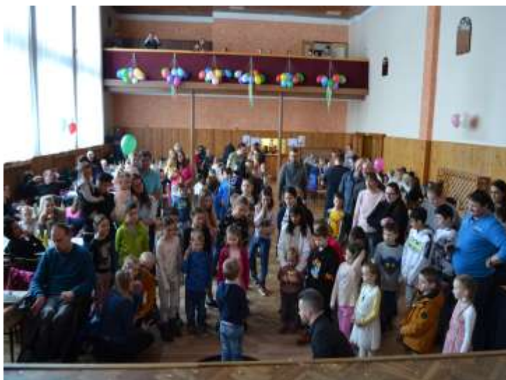
Kouzelnické vystoupení pro děti (11. března 2023)