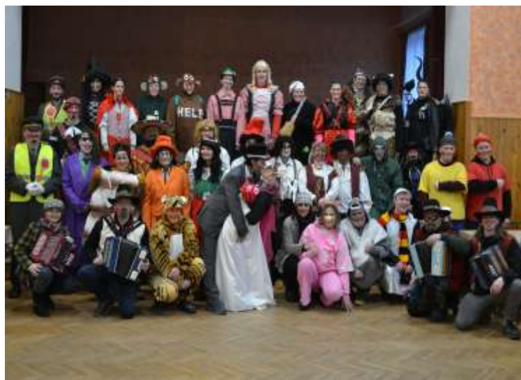
Fašanky (18. února 2023)