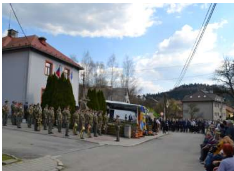
Pietní akt (22. dubna 2023)