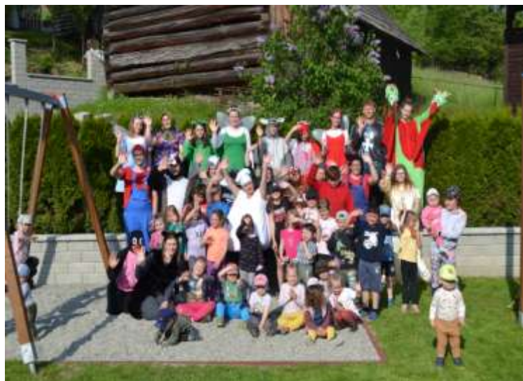
Pohádkový les (27. května 2023)