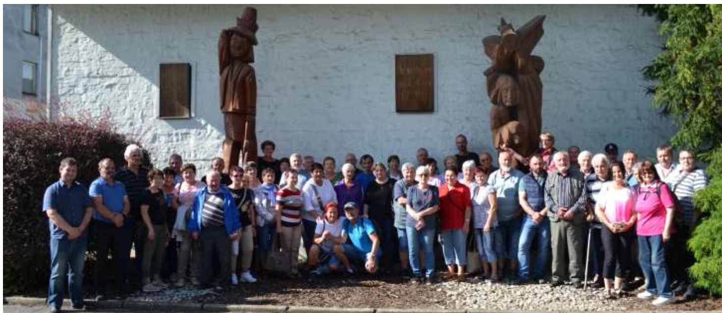
Zájezd důchodců v areálu likérky Jelínek Vizovice (21. září 2023)