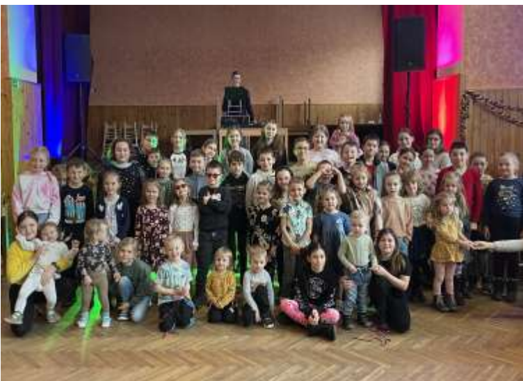
Kouzelnické vystoupení pro děti (9. března 2024)