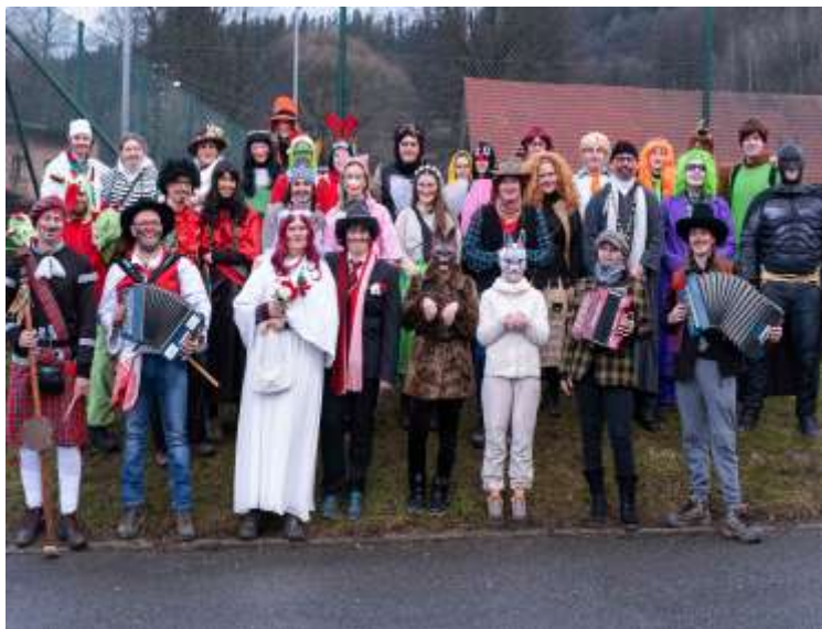
Fašanky (10. února 2024)