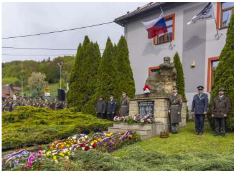
Pietní akt (20. dubna 2024)