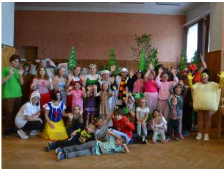
Pohádkový les (1. června 2024)