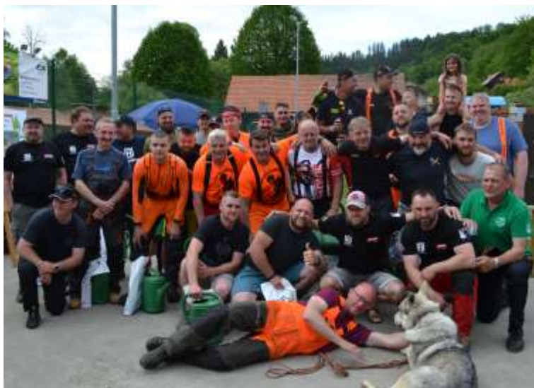
Prlovský drvař (11. května 2024)