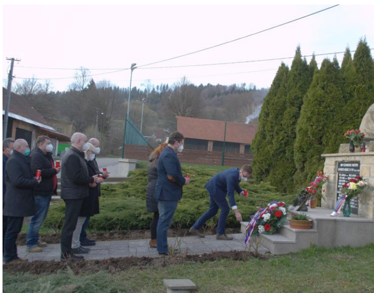
Hejtman pokládá věnec u pomníku (22. dubna 2021)