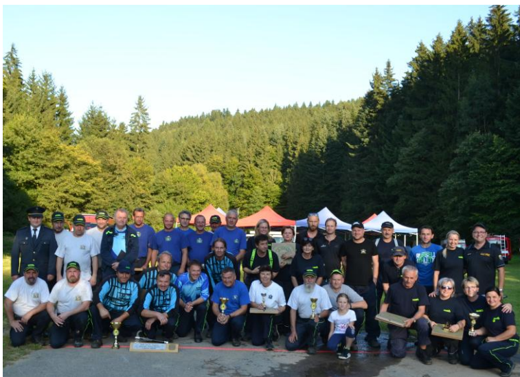
Memoriál Vojtěcha Štacha (11. září 2021)