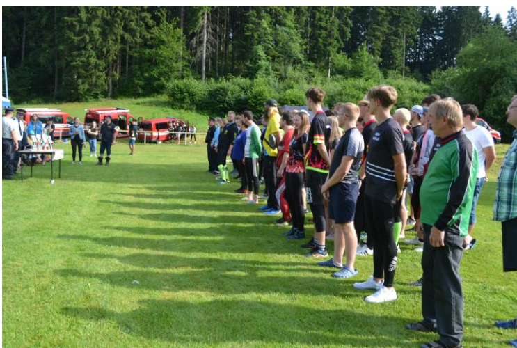
Memoriál obětí Prlova (11. července 2021)