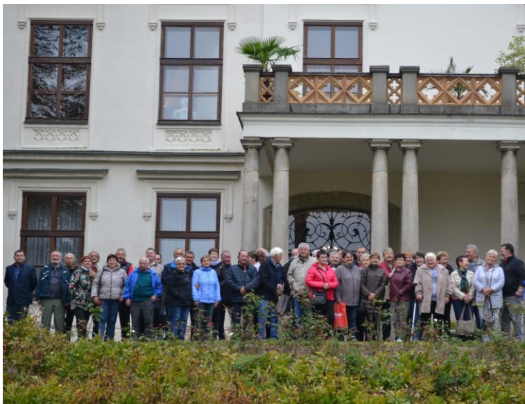
Zájezd důchodců u zámku v Lešné (6. října 2021)